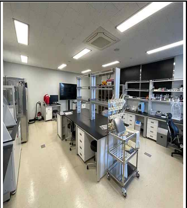
제주청 증거물 분석·보관실