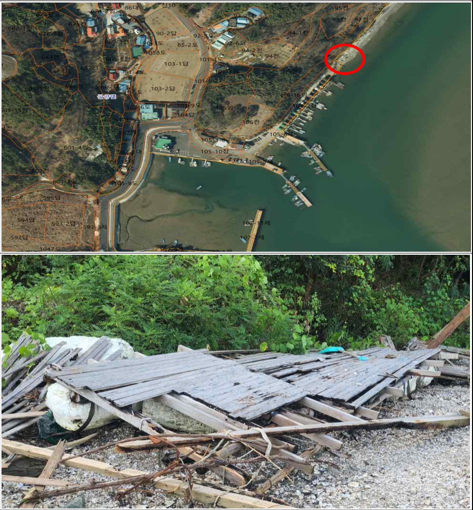
방치뗏목 위치도 및 전경사진

위 물건은 장기간 방치되어 있던 뗏목으로서 공유수면의 효용을 저해할 뿐만 아니라, 수질을 오염시킬 우려가 있으므로 공유수면 관리 및 매립에 관한 법률 제6조의 규정에 따라 위와 같이 직권으로 제거하고자 하오니 이의가 있거나 문의사항이 있으신 분은 2024년 9월 10일까지 사천시 해양수산과(해양보전팀, 055-831-3127, 3130)로 연락하여 주시기 바랍니다.