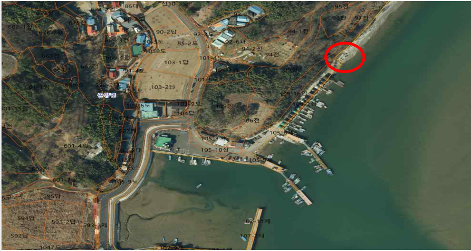
방치선박 위치도 및 전경사진