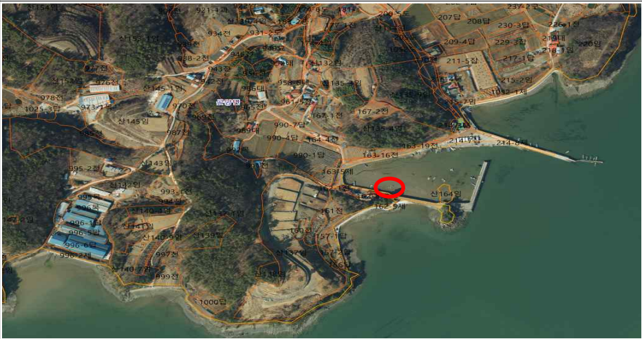
방치뗏목 위치도 및 전경사진