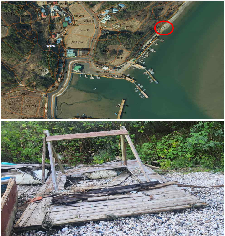
방치뗏목 위치도 및 전경사진

위 물건은 장기간 방치되어 있던 뗏목으로서 공유수면의 효용을 저해할 뿐만 아니라, 수질을 오염시킬 우려가 있으므로 공유수면 관리 및 매립에 관한 법률 제6조의 규정에 따라 위와 같이 직권으로 제거하고자 하오니 이의가 있거나 문의사항이 있으신 분은 2024년 9월 10일까지 사천시 해양수산과(해양보전팀, 055-831-3127, 3130)로 연락하여 주시기 바랍니다.