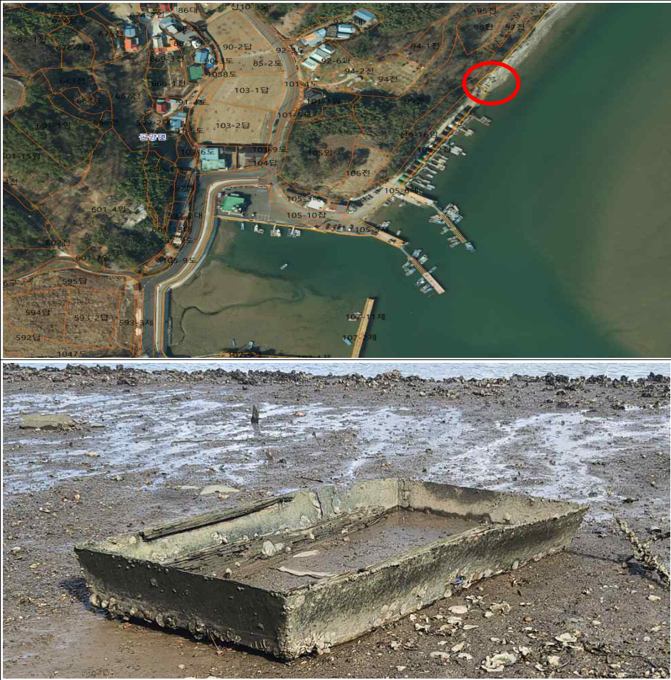
방치선박 위치도 및 전경사진

위 물건은 장기간 방치되어 있던 선박으로서 공유수면의 효용을 저해할 뿐만 아니라, 수질을 오염시킬 우려가 있으므로 공유수면 관리 및 매립에 관한 법률 제6조의 규정에 따라 위와 같이 직권으로 제거하고자 하오니 이의가 있거나 문의사항이 있으신 분은 2024년 9월 10일까지 사천시 해양수산과(해양보전팀, 055-831-3127, 3130)로 연락하여 주시기 바랍니다.