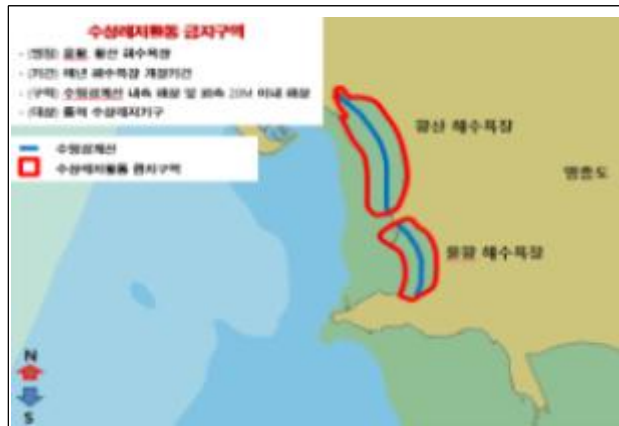
1. 을왕 해수욕장 2. 왕산 해수욕장