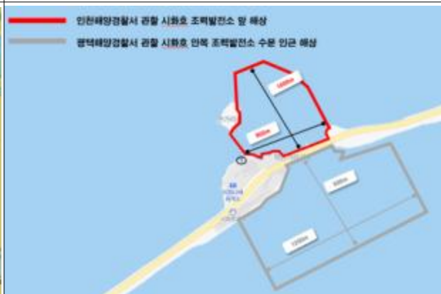
11. 시화호 조력발전소 앞 해상