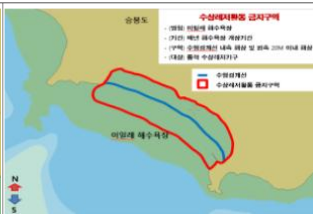
3. 이일레 해수욕장