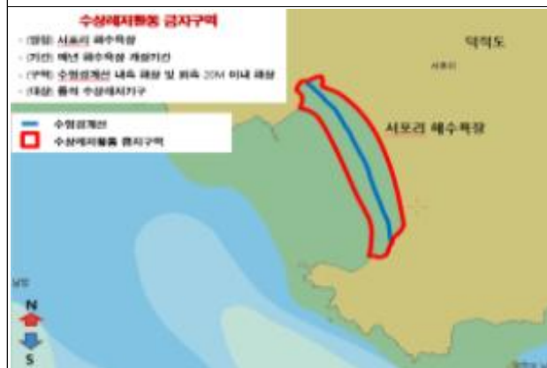
4. 서포리 해수욕장