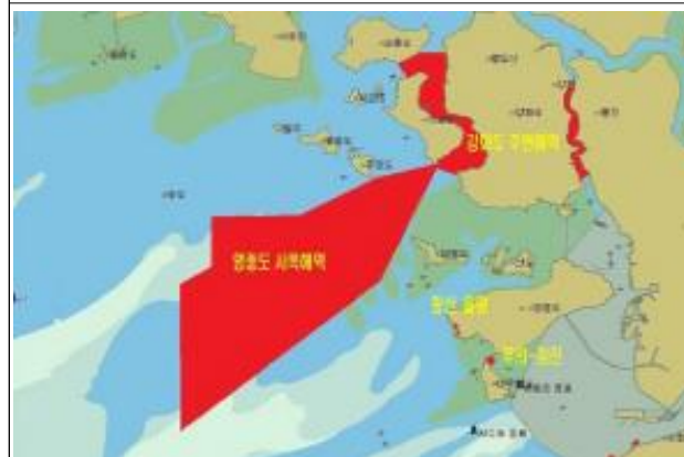
9. 강화도 주변 해역 10. 영종도 서쪽 해역