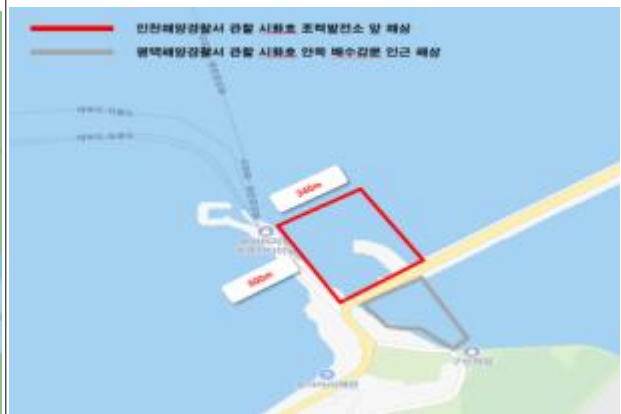
8. 시화호 배수갑문 앞 해상