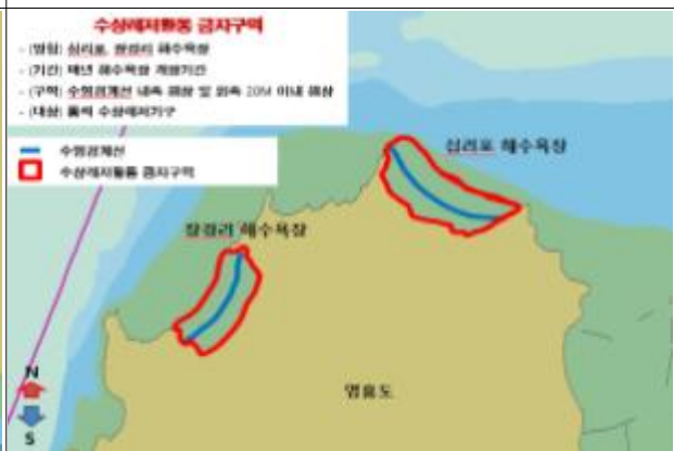
5. 장경리 해수욕장 6. 십리포 해수욕장